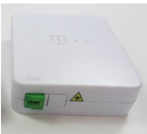
Gf-TA simplex, 1F

Ihre Rückseite ist für die Wandmontage mit Klebeband geeignet. Wenn installiert, sieht die Rückseite 5 verschiedene Führungen für das Eingangskabel vor, um allen möglichen Situationen geeignet zu sein.