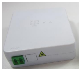
Gf-TA duplex, 2F